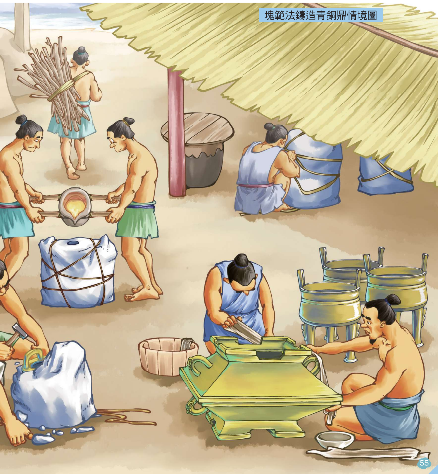
塊範法鑄造青銅鼎情境圖

後世，竹簡紙張的發明取代了青銅器作為文字載體，不但讓文字記錄更加方便，也促使文字的演進更為豐富。