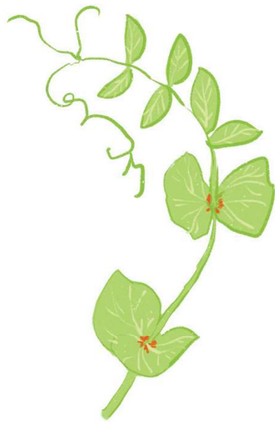
葉軸先端的分歧性卷鬚