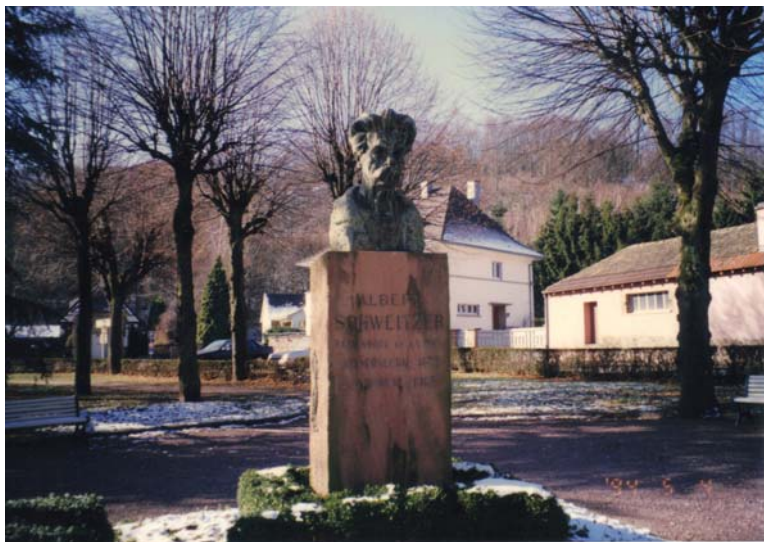
史懷哲故居紀念館為樸實民宅，史懷哲塑像傍著非洲行醫器物，環繞參天古樹瀟灑一股安靜、平淡又深邃的氣氛。